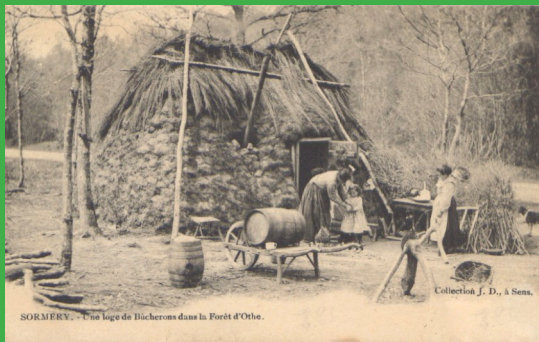
SORMERY - Fourneau de bûcherons dans la Forêt d'Othe.

D'autres activités autour de la forêt tenaient une place importante pour la vie des habitants du Pays d'Othe : on « faisait du bois » pour se chauffer, mais aussi pour le vendre. La fabrication de charbon de bois avait lieu en forêt, comme le témoigne d'anciennes photos et de noms de lieux comme La Charbonnière.