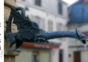
RN 77 D 10 Troyes

2 Les dragons de bronze datent du XVI e siècle et agrémentent la fontaine de style gothique et Renaissance, reconstruite en 1984. Au dessus, qui les protègent ? Les saints Martin et Florentin, les saintes Barbe et Béate ainsi qu'Adam et Ève.