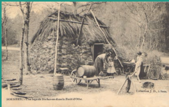
SORMERY : Four à la cuisson de briques dans la Forêt d'Othe.

7. La forêt fait partie du massif de la forêt d'Othe, et couvre plus d'un tiers de la surface communale. Le chêne en est l'essence majoritaire, mais charmes, hêtres, noisetiers ou acacias, entre autres, y poussent en nombre. Elle abrite une flore et une faune nombreuse et variée. La forêt communale - 156 ha - est gérée par l'ONF et fait l'objet d'un plan d'exploitation et de régénération suivi. Elle était génératrice de richesses : couplée à l'extraction d'argile, elle permettait la cuisson de briques et de tuiles très prisées (la Tuilerie) mais aussi la fabrication de charbon de bois.