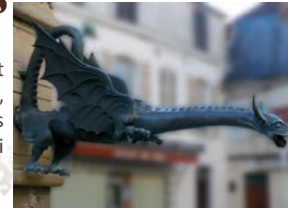
RN 77 D 10 Troyes

2 Les dragons de bronze datent du XVI e siècle et agrémentent la fontaine de style gothique et Renaissance, reconstruite en 1984. Au dessus, qui les protègent ? Les saints Martin et Florentin, les saintes Barbe et Béate ainsi qu'Adam et Ève.